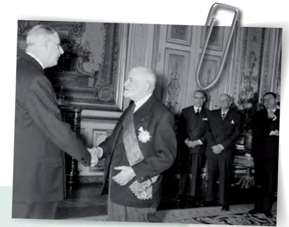
René Cassin et le général de Gaulle.