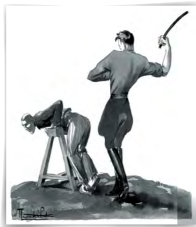
Où la moindre peccadille coûtait 25 coups. Dessin de Maurice de la Pintièrre, déporté au camp de Dora, réalisé à son retour de déportation en 1945.