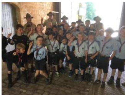
Groupe scouts d'Arlon