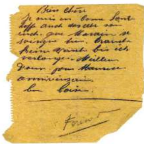
Figure 1 - Messages clandestins écrits par Fernand Traver lors de son internement au fort de Queuleu.

La suite de la biographie sera publiée dans la prochaine lettre