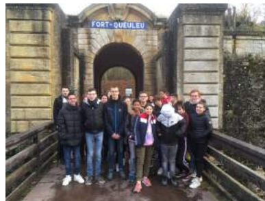
Collège André Malraux (Delme)