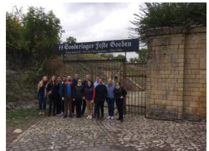
Militaires de l'ESID