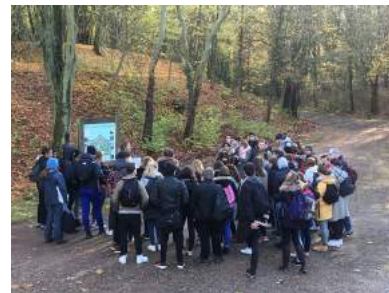
Lycée Jean-Baptiste Vuillaume (Mirecourt)