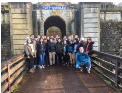
Ecole polytechnique de Palaiseau Master of Science & Technologie

Ces visites sont d'une importance capitale pour faire découvrir, à des jeunes, les lieux où se sont déroulés des événements dramatiques de notre histoire locale et nationale et ainsi faire vivre cette mémoire et maintenir le « plus jamais ça ».