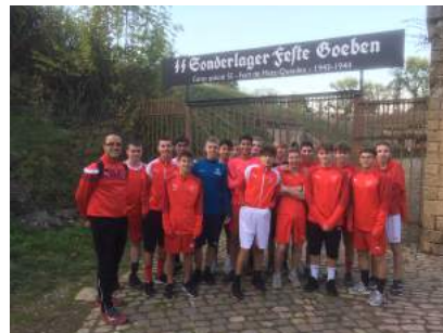
Footballeurs de Magny