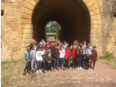
Ecole primaire Pierre et Marie Curie (Woippy)

2019 une année riche de l'école primaire Pierre et Marie Curie de Woippy, à l'école Polytechnique de Palaiseau