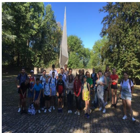
Groupe de jeunes franco-allemands

Visites exceptionnelles de groupes scolaires et militaires allemands qui dans le cadre de leur éducation et formation sont venus visiter le Sonderlager. Il est évident que ce genre de visite est très particulière car il est hors de question de faire porter la responsabilité des actes commis aux descendants. On parle bien sûr de faits perpétrés par la Gestapo et les SS mais dans le cadre de la fraternité franco-allemande. Ces visites ont été aussi très instructives pour nous association car elles montrent l'intérêt de ces jeunes pour mieux comprendre ce passé si encombrant.