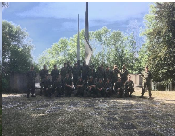
Jeunes militaires allemands de la Bundeswehr